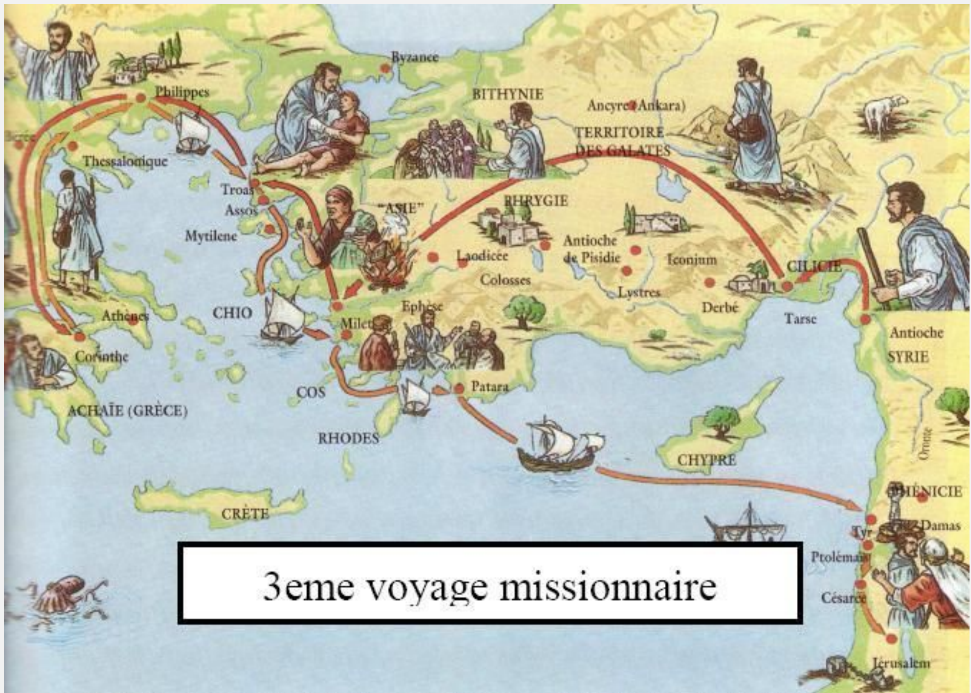
3eme voyage missionnaire